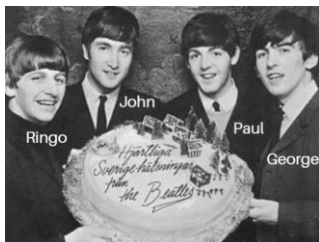
Los Beatles con sus nombres 1

¿Qué los hacía tan especiales? Algunas personas piensan que los Beatles cambiaron el sonido de la música pop, porque ellos fueron la primera banda británica en escribir sus propias canciones y música. Antes de ellos, la mayoría de las bandas y de los cantantes hacían que se las escribieran.